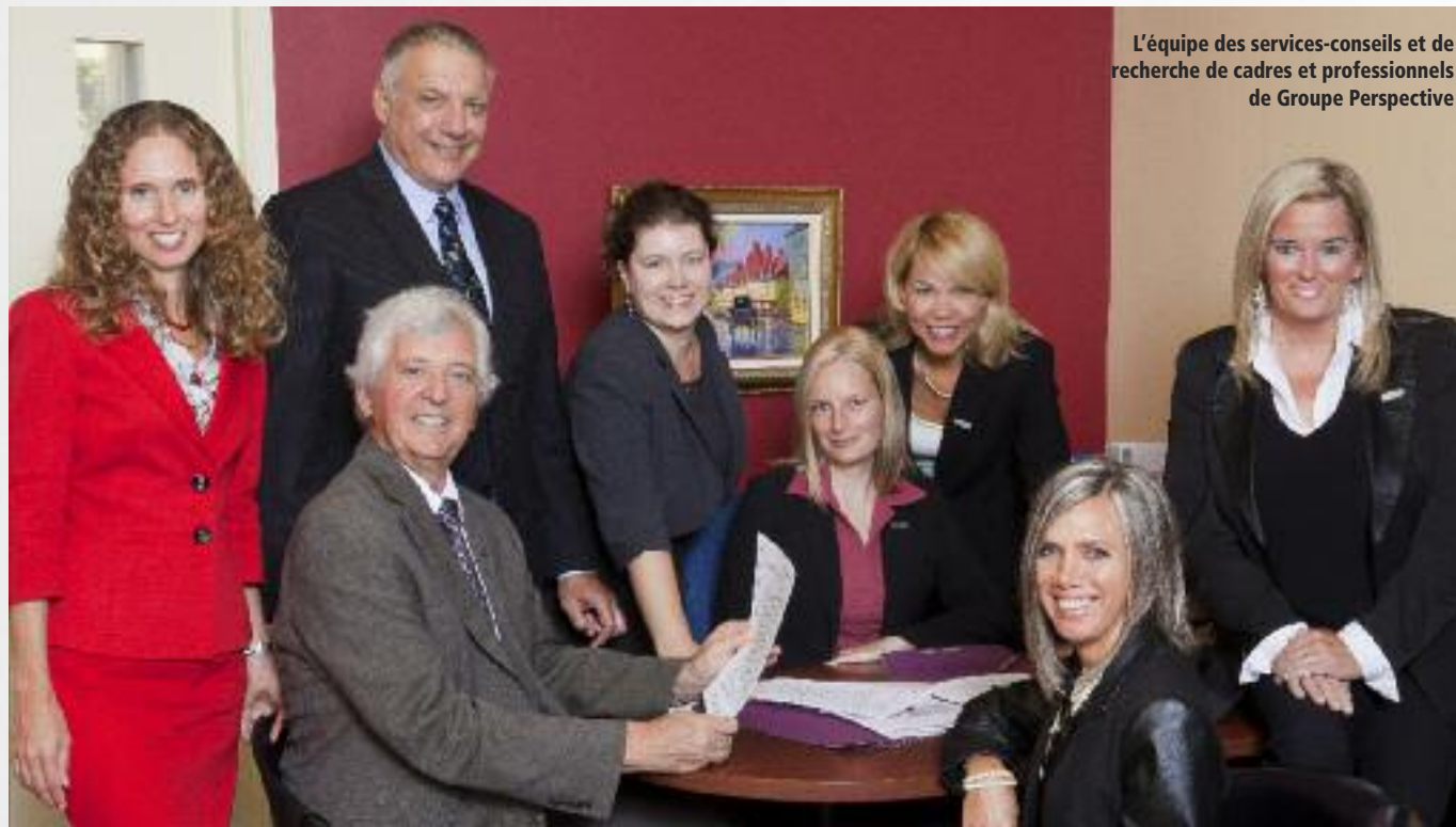
L'équipe des services-conseils et de recherche de cadres et professionnels de Groupe Perspective

Chaque année, VoirGRAND.tv reçoit à ses auditions des centaines d'aspirants déterminés à profiter de la tribune exceptionnelle que représente une participation à cette série télévisée unique. Six concurrents sont retenus et chacun verra une émission entière lui être consacrée. C'est à cette occasion que des experts chevronnés dispenseront à nos concurrents des conseils précis, inspirés directement de l'analyse de leurs entreprises.